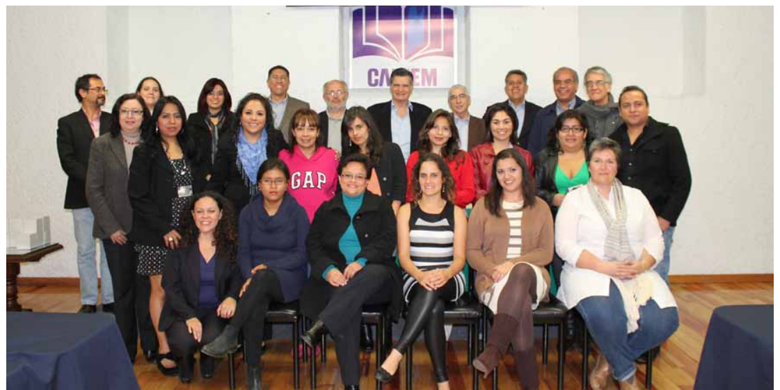
Expositores y egresados de la Beca Juan Grijalbo- CONACULTA

El presidente de la CANIEM afirmó también que la colaboración del CONACULTA es fundamental para la realización del seminario. Aseguró que este encuentro es único en su género en América Latina, y en esta edición contó con la participación de 24 profesionales del medio, quienes brindaron su tiempo, su conocimiento